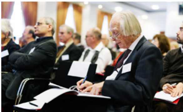
Denis Noble tillsammans med deltagare vid konferensen i London.

Hösten 2016 samlades återigen ett stort antal forskare från olika länder på Royal Society i London till en konferens, där man uttryckte att nydarwinismen fortfarande brast i att förklara livets komplexitet, uppkomsten av nya strukturer och övergångsformer mellan växter och djur. Man lanserade teorier som gav vad man då tyckte vara bättre förklaringar, men även de har visat sig vara bristfälliga. 6